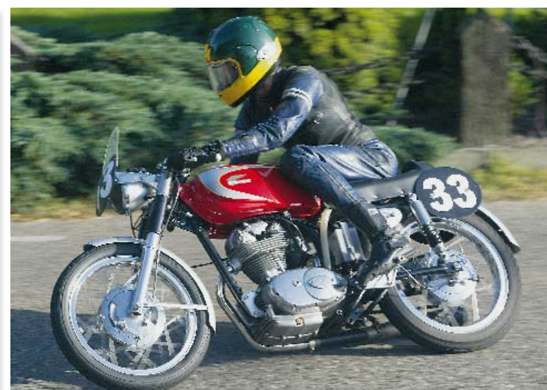
Theo Bult terug op Ducati, het merk waarop hij zijn racecarrière begon.

man: "Jammer dat de tweetakten verdwijnen. Onze generatie coureurs is daar mee opgegroeid."